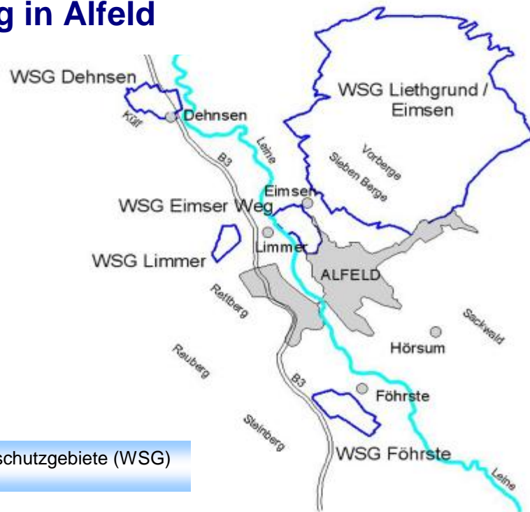
Lage der Wasserschutzgebiete (WSG)

Die Wasserwerk Alfeld GmbH garantiert 22.515 Einwohnern in der Stadt Alfeld und den 15 Ortsteilen die Versorgung mit Trinkwasser von bester Qualität! Die rund 6.000 Haushalte benötigen eine Trinkwassermenge von ca. 1,1 Mio. m 3 pro Jahr. Diese wird durch die Wasserförderung der Wasserwerke Liethgrund und Eimser Weg und durch die Brunnen Eimsen, Dehnsen, Föhrste und Limmer-Süd gedeckt.